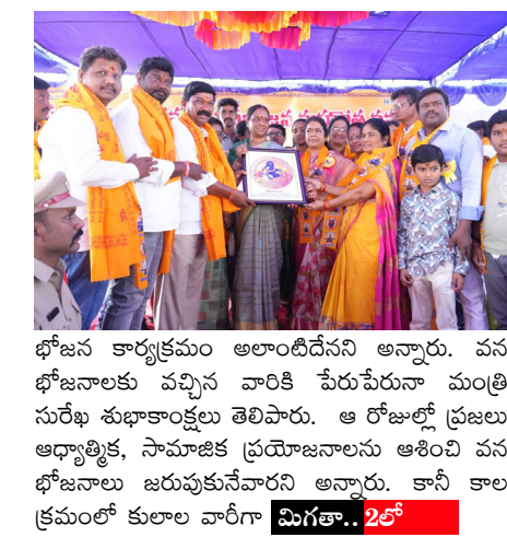
భోజన కార్యక్రమం అలాంటిదేనని అన్నారు. వన భోజనాలకు వచ్చిన వారికి పేరుపేరుగా మంత్రి సురేఖ శుభాకాంక్షలు తెలిపారు. ఆ రోజుల్లో ప్రజలు అధ్యాత్మిక, సామాజిక ప్రయోజనాలను ఆశించి వన భోజనాలు జరుపుకునేవారని అన్నారు. కానీ కాల క్రమంలో కూలాల వారీగా మిగుతా.. 25

పరంగల్, నవంబర్ 23 (నమస్తే ఉదయం): వీలావరంగల్లోని చింతల్ గ్రౌండ్లో జరిగిన పద్మశాలి కార్యక్రమ వసభోజన మహోత్సవానికి అటవీ, పర్యావరణ, దేవాలయ ధర్మాదాయ శాఖ మంత్రి కొండా సురేఖ హాజరయ్యారు. ఈ సందర్భంగా మంత్రికి వేదపండితులు పూర్వ కుంభంతో స్వాగతం పలికారు. కార్యక్రమ నిర్వాహకులు, ప్రజలు మంత్రిని సాదరంగా ఆహ్వానించారు. ప్రత్యేక పూజా కార్యక్రమాల్లో పాల్గొన్న అనంతరం మంత్రి సురేఖని నిర్వాహకులు శాలావతో సన్మానించి, జ్ఞాపకను అందించారు. ఈ సందర్భంగా మంత్రి సురేఖ మాట్లాడుతూ, పూర్వీకులు మన ప్రయోజనాలను కోరి అనేక ఆచారాలను, సంప్రదాయాలను ఏర్పరిచారని, సామూహిక జీవన విధానాన్ని అలవాటు చేసే వన