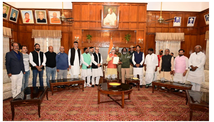
గవర్నర్ను కలిసి ఇండియా కూటమి బలం, ప్రభుత్వం ఏర్పాటుకు సిద్ధమని లేఖ అందచేస్తున్న సీఎం హేమంత్ సోరెన్, డిప్యూటీ సీఎం భట్టి విక్రమార్కు మల్లు

రంగారెడ్డి సంపుటి: 02 సంచిక: 121 పేజీలు: 4 వెల: 4/- సోమవారం 25, నవంబర్ 2024 ఎడిటర్: ఎం.వనితా రెడ్డి