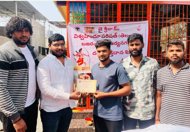
రక్తదానం చేసిన వారికి సర్టిఫికేట్లు బహుకరిస్తున్న బజరంగ్ దళ్ నేతలు

రాజేంద్ర నగర్, సవంబరు 24 (సమస్తే ఉదయం): మైలార్ దేవుపల్లి డివిజన్ బాబుల్ రెడ్డినగర్ లో ఆదివారం విశ్వహిందు వరిషత్, భజరంగ్ దళ్ ఆధ్వర్యంలో జిల్లా ఆధ్వర్యంలో మెగా రక్తదాన శిబిరం నిర్వహించారు. ఈ కార్యక్రమంలో స్థానిక యువకులు పెద్ద సంఖ్యలో పాల్గొని రక్తదానం చేశారు.