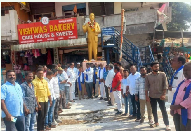
భారత రాజ్యాంగ దినోత్సవ వేడుకలు జరుపుకుంటున్న అంజెద్దర్ సంఘ నాయకులు