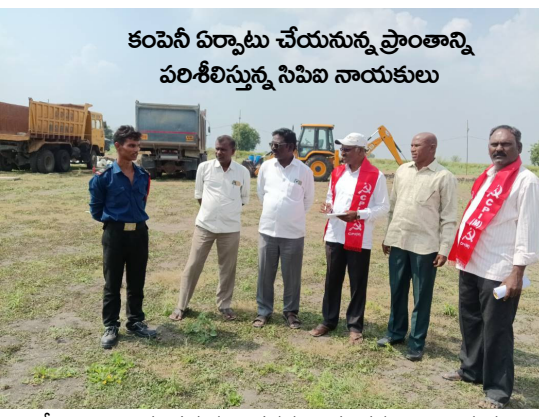
కంపెనీ ఏర్పాటు చేయనున్న ప్రాంతాన్ని పరిశీలిస్తున్న సిపిఎం నాయకులు