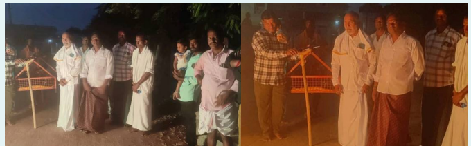
శ్రీ వేణుగోపాల స్వామి ఉత్సవమూర్తులను ఊరేగిస్తున్న దృశ్యం

మండలంలోని రామకృష్ణాపురం గ్రామంలో దీపావళి పండుగను గ్రామస్థులు భక్తిశ్రద్ధలతో ఘనంగా జరుపుకున్నారు. శనివారం దీపావళి పండుగ సందర్భంగా