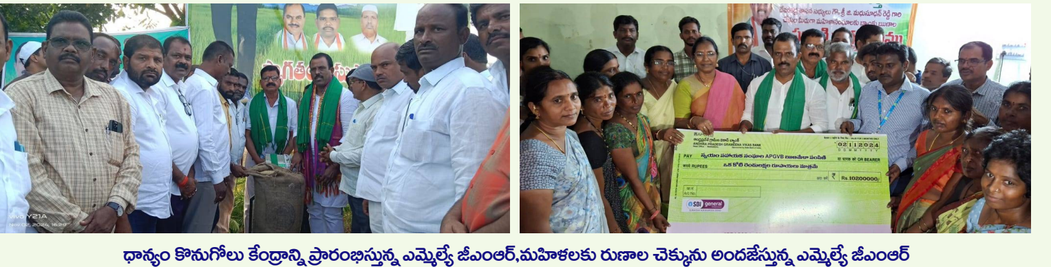
ధాన్యం కొనుగోలు కేంద్రాన్ని ప్రారంభిస్తున్న ఎమ్మెల్యే జీఎంఆర్, మహిళలకు రుణాల చెక్కును అందజేస్తున్న ఎమ్మెల్యే జీఎంఆర్

కాస్టిటిక్ చార్జీలు: బాలికలు 3 నుంచి 7వ తరగతి విద్యార్థులకు రూ.55 నుంచి రూ.175కు పెంపు 8 నుంచి 10వ తరగతి విద్యార్థులకు రూ.75 నుంచి రూ.275కు పెంపు బాలురు 3 నుంచి 7వ తరగతి విద్యార్థులకు రూ.62 నుంచి 150కు పెంపు 8 నుంచి 10వ తరగతి విద్యార్థులకు రూ.62 నుంచి రూ.200కు పెంపు.