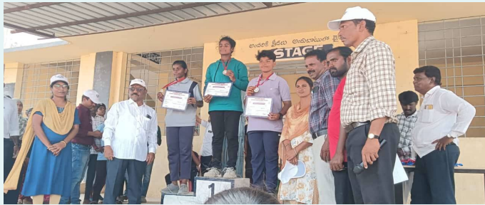
నల్లపేటలో ఎంపికైన అత్యుత్తమ

గద్వాల ఇండోర్ స్టేడియంలో శనివారం నిర్వహించిన అథ్లెటిక్స్ ఎస్ జి ఎస్ అండర్ 17 బాలికల విభాగంలో షాట్ పుట్ లో కేజిబివి కేటీడాడ్ విద్యార్థిని అత్యుత్తమ