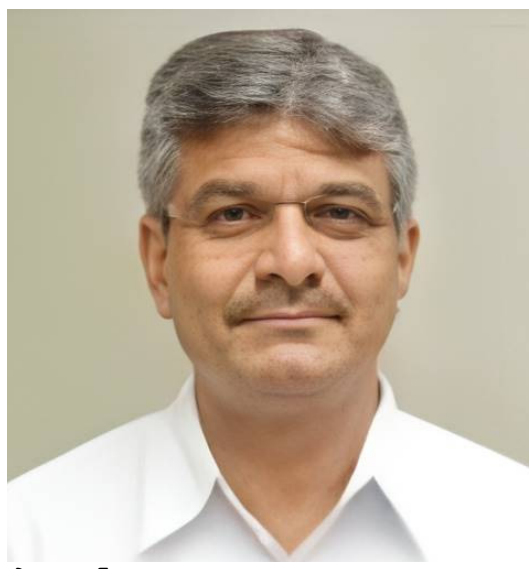
పామాయిల్ పరిశ్రమలు వందలాది ఉద్యాన విద్యార్థులను