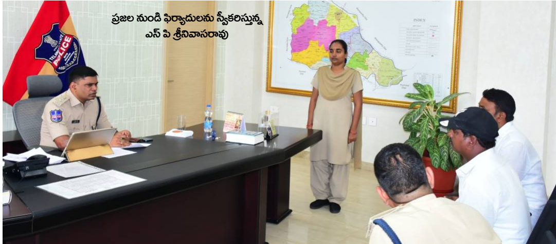
ప్రతి ప్రజావాణి కార్యక్రమం ద్వారా సమస్యలు పరిష్కరిస్తున్నామని తెలియజేశారు. ఈ కార్యక్రమంలో డి.ఎస్సీ సత్వరారాయణ పాల్గొన్నారు. ఈ పిర్యాదులలో భూ వివాదాలకు సంబంధించి -02 పిర్యాదులు రావడం జరిగింది.

గద్వాల జిల్లా ప్రతినిధి, సవంబర 4(నమస్తే ఉదయం): ప్రజల నుంచి స్వీకరించిన ఫిర్యాదులను సంబంధిత అధికారులు విచారింపి న్యాయం చేస్తామని గద్వాల జిల్లా ఎస్సీ శ్రీనివాసరావు తెలిపారు. సోమవారం ప్రజావాణి కార్యక్రమంలో భాగంగా బాదితుల నుండి జిల్లా ఎస్సీ శ్రీ డి శ్రీనివాస రావు స్వీకరించారు. సోమవారం జిల్లా పోలీస్ కార్యాలయంలో జిల్లా ఎస్సీ డి శ్రీనివాస రావు ఐపీఎస్ ప్రజావాణి కార్యక్రమంలో భాగంగా బాదితుల నుండి ఫిర్యాదులను స్వీకరించి వాటిని చట్టప్రకారం పరిష్కరించాల్సిందిగా సంబంధిత అధికారులకు పలు సూచనలు చేశారు. పోలీస్ స్టేషన్ కు వచ్చే ఫిర్యాదులను ఎలాంటి అలసట లేకుండా తక్షణ పరిష్కారం అయ్యే విధంగా తగిన చర్యలు తీసుకోవాలని సంబంధిత స్టేషన్ ల సీఐ, ఎస్ఐ లకు ఫోన్ ద్వారా మాట్లాడి సమస్య స్థితిని, పరిష్కారానికి సూచనలు చేశారు. ప్రజలు నిర్భయంగా, మాజీ వ్యక్తి ప్రయోగం లేకుండా ఎలాంటి, పైరపిలు లేకుండా స్వచ్ఛందంగా పోలీస్ స్టేషన్ల వద్ద వినియోగించుకుంటూ, వారి వారి సమస్యలు చట్ట ప్రకారం పరిష్కరించుకోవాలి, పోలీసులు ప్రజలకు మరింత దగ్గరయ్యేలా, శాంతి భద్రతల పరిరక్షిస్తూ ముందుకు సాగడమే లక్ష్యంగా జిల్లా పోలీస్ శాఖ పని చేస్తుందని జిల్లా ఎస్సీ తెలియజేశారు. ప్రజా సమస్యలపై ఫిర్యాదులు నేరుగా స్వీకరిస్తూ