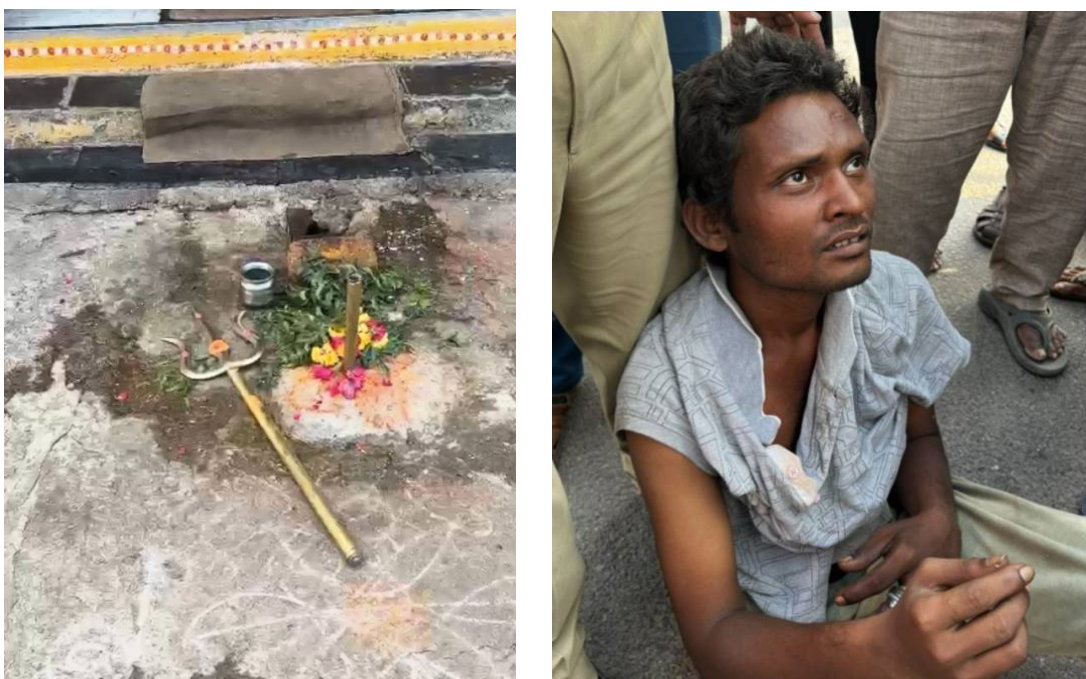
కట్ట మైసమ్మ అలయంలో ధ్వంసమైన త్రిశూలం, నిందితుడుని పట్టుకున్న స్థానికులు

శంషాబాద్ పట్టణంలోని కట్ట మైసమ్మ దేవాలయంపై శుక్రవారం దాడి జరిగింది. హైదరాబాద్ బెంగళూరు జాతీయ రహదారి వద్ద ఉన్న దేవాలయంపై దాడి జరిగింది. దాడిలో పాల్గొంది బస్ వద్ద ఉన్న కట్ట మైసమ్మ దేవాలయం వద్ద ఏర్పాటు చేసిన త్రిశూలాన్ని దుండగుడు ధ్వంసం చేశారు. ఇది గమనించిన స్థానికులు అతడి పట్టుకుని దేహశుద్ధి చేశారు. శంషాబాద్ పట్టణంలోని ఎయిర్ పోర్ట్ కాలనీలో మూడు రోజుల క్రితం హనుమాన్ దేవాలయం వద్ద ఉన్న నవగ్రహ విగ్రహాలను దుండగులు ధ్వంసం చేసిన సంఘటన మరువకముందే శుక్రవారం మరో ఘటన జరిగింది. దీనితో స్థానికులు ఉద్రిక్తత నెలకొని ప్రజలు తీవ్ర ఆందోళనకు గురవుతున్నారు. మంగళవారం జరిగిన సంఘటన స్థలాన్ని కేంద్ర హెంకాశాఖ సహాయ మంత్రి బిండి సంజయ్ కుమార్ శుక్రవారం సాయంత్రం పరిశీలించడానికి వస్తున్న సమయంలోనే ఈ సంఘటన జరగడం తీవ్ర చర్చాయాంశంగా మారింది. హైదరాబాద్ బెంగళూరు జాతీయ రహదారిపై శంషాబాద్ పట్టణంలోని సిద్దికత్తి వద్ద ఉన్న కట్ట మైసమ్మ దేవాలయం ముందు త్రిశూలాన్ని ఏర్పాటు చేశారు. శుక్రవారం మధ్యాహ్నం ఓ దుండగుడు దాన్ని తొలగించి ధ్వంసం చేయడానికి ప్రయత్నించారు. అలయ పరిసరాల్లో ఉన్నవారు వెంటనే దానిని గమనించి ఆ యువకుడిని పట్టుకుని దేహశుద్ధి చేశారు. సంఘటన స్థలానికి చేరుకున్న పోలీసులు అతడిని