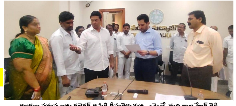
రజకుల సమస్యలను కలెక్టర్ దృష్టికి తీసుకుకున్న ఎమ్మెల్యే మర్రి రాజశేఖర్ రెడ్డి

కలెక్టర్ దృష్టికి రజకుల సమస్యలు: ఎమ్మెల్యే మర్రి రాజశేఖర్ రెడ్డి మల్లాజిగిరి, సవంబర్ 8(సమస్తే ఉదయం): ప్రహారీ గోడను నిర్మించిన తర్వాత స్థానికులు కొందరు అడ్డంకులు ధోళిపాల్ స్థలం కాలనీకి చెందినదిని ఒకరిద్దరు స్వాధీనం చేసుకుని ఆలోచనలతో అడ్డంకులు సృష్టించారని ఎమ్మెల్యే రాజశేఖర్ రెడ్డి కలెక్టర్ కు వివరించారు. మరో గౌరవ నగర్ డివిజన్ పరిధిలోని జ్యోతి నగర్ లో దశాబ్దాలుగా రజకులు ధోళిపాల్ ఏర్పాటు చేసుకుని అక్కడే తమ పుట్టింపు చేసుకుంటే కొన్ని తరాల వారు జీవనోపాధి సాగిస్తున్నారు. గతంలో ధోళిపాల్ తన అధికారాలు అధికారులతో నిర్మించి ఇప్పటికీ నిర్మించి అధికారులు రజకులను కేంద్రంలో క్రూరువేతకు ఒప్పుకున్నారు. ధోళిపాల్ ను కూలివేసిన అనంతరం చుట్టూ