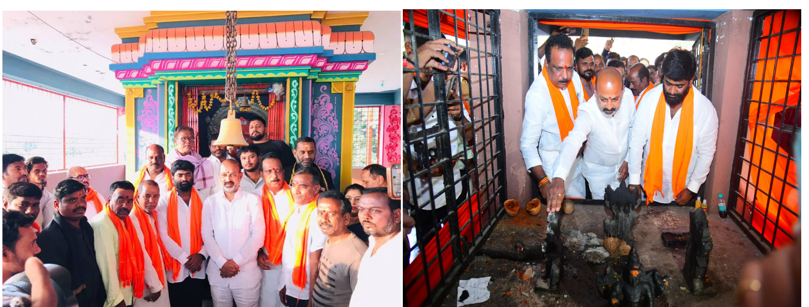
విగ్రహాలు ధ్వంసమైన అలయాన్ని సందర్శించిన కేంద్ర మంత్రి బండి సంజయ్

ఇప్పటికైనా డీఎస్సీ ఎస్సెలపై సిరియస్ గా వ్యవహరించాలని డిమాండ్ చేశారు. ఈ అన్ని సభలపై మానవ హక్కులు,