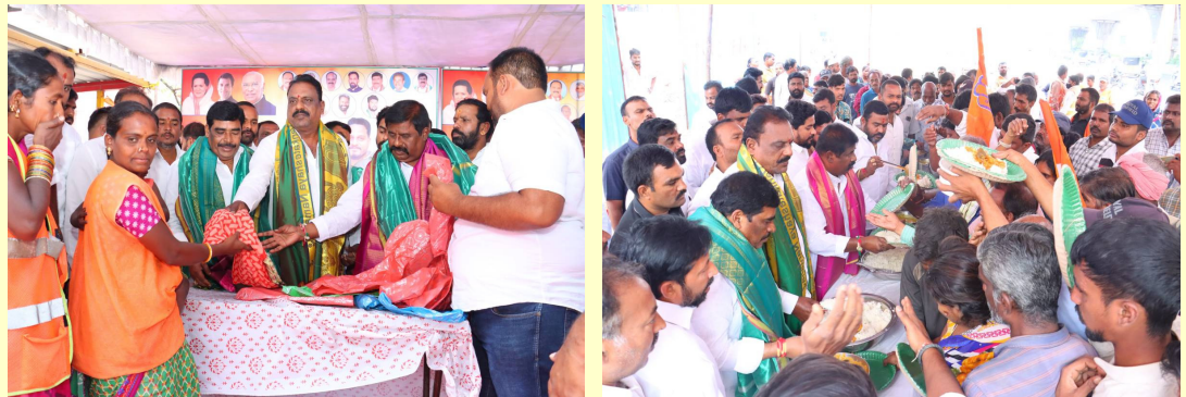
పారిశుధ్యకార్మికులకు వీరల పంపిణీ, అన్నదాన కార్యక్రమం