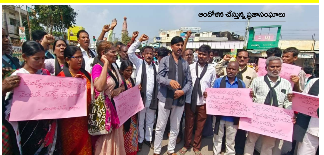
అందోళన చేస్తున్న ప్రజాసంఘాలు