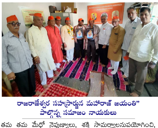
రాజరాజేశ్వర సహస్రార్జున మహారాజ్ జయంతి" పాల్గొన్న సమాజే నాయకులు