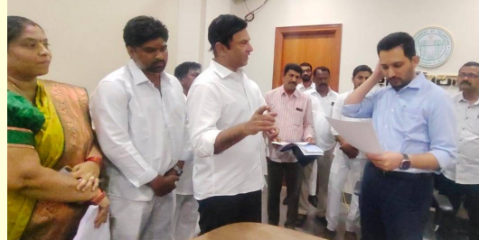
మేధుల్ - మల్లాజిగిరి జిల్లా కలెక్టర్ గౌరవ పాత్రో కు వినతి పత్రం అందజేశారు.

లిజిస్ట్రేషన్లు నిలిపివేతను తొలగించాలని కలెక్టర్ కోలిన ఎమ్మెల్యే మర్రి రాజశేఖర్ రెడ్డి మల్లాజిగిరి, సవంబర్ 8(సమస్తే ఉదయం): మల్లాజిగిరి నియోజకవర్గంలో ఐదు దశాబ్దాలుగా ఇల్లు నిర్మాణం నిలిపివేయడం ప్రజల రిజిస్ట్రేషన్ లను నిలిపివేయడం పట్ల తీవ్ర ఇబ్బందులు గురవుతున్నారని మల్లాజిగిరి శాసనసభ్యులు మర్రి రాజశేఖర్ రెడ్డి జిల్లా కలెక్టర్ కు గౌరవ పాత్రో దృష్టికి తీసుకెళ్లారు. రిజిస్ట్రేషన్లు నిలిపివేత కోరుతూ వక్స్ బోర్డు సి.ఈ. ఓ ప్రకటన చేపట్టడంతో పేద ప్రజలకు అన్యాయం జరగకుండా సవరణలు కోరుతూ మల్లాజిగిరి ఎమ్మెల్యే మర్రి రాజశేఖర్ రెడ్డి