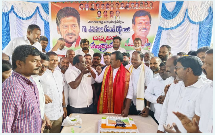
పార్టీ శ్రేణులకు కేక తినిపిస్తున్న ఎమ్మెల్యే జిఎంఆర్

ఉద్యోగ అవకాశాలతో ఈ కోర్సు కు అధికమైన డిమాండ్ ఉంది. ఈ డిమాండ్ లో భాగంగా అనేకమంది విద్యార్థులను సూచన మేరకు NRI/ Self Finance కోట కింద వెటర్నరీ కోర్సులో ప్రవేశాలు కారకు అక్టోబర్ 19న విశ్వవిద్యాలయం ఉన్నతాధికారులు నోటిఫికేషన్ జారీ చేశారు. ఈ నోటిఫికేషన్ వివరాలు విశ్వవిద్యాలయ వెబ్సైట్ http://tsvu.edu.in నందు గమనించ గలరని డాక్టర్ రఘునందన్ సూచించారు. ఈ NRI కోట కింద ప్రవేశాలు పొందాలనుకునేవారు ప్రవేశ అర్హతల గురించి రుసుము వివరాల గురించి ఈ వెబ్సైట్ను సంప్రదించి దరఖాస్తు చేసుకోవడానికి ఈనెల 11 ఆఖరి తేదీ అని విశ్వవిద్యాలయ అధికారులు సూచించారు. NRI/ Self Finance కోట కింద వెటర్నరీ కోర్సులో ప్రవేశ