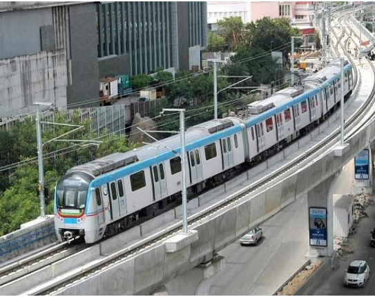
తగ్గుతుందని అధికారులు భావిస్తున్నారు. మెట్రో సేవలు వేగం, సౌకర్యం, విశ్వసనీయతలో ముందంజలో ఉంటూ, హైదరాబాద్ సగంకొత్త కొత్త గమ్యానికి తీసుకెళ్తున్నాయి. ఆఫర్ నేటి నుంచే అమల్లోకి రానుంది.

మెట్రోలో ప్రయాణం తక్కువ ఖర్చుతో పాటు ట్రాఫిక్ సమస్య నుంచి ఉపశమనం అందించడంలో ముఖ్య పాత్ర పోషిస్తోంది. ఈ నేపథ్యంలో, రెగ్యులర్ మెట్రో ప్రయాణికులను మరింత ప్రోత్సహించేందుకు ఎల్ అండ్ టీ మెట్రో ఒక ప్రత్యేక కార్యక్రమాన్ని ప్రారంభించింది. డిసెంబర్ 1 నుండి ఫిబ్రవరి 28 వరకు, మూడు నెలల కాలానికి ప్రయాణాలను ఆధారంగా తీసుకొని ప్రయాణికులకు షాటింగ్, గోల్డ్, సిల్వర్ బ్యాండ్లు అందించనున్నట్లు అధికారులు ప్రకటించారు. 51 ట్రిపుల్ కన్నా ఎక్కువగా ప్రయాణించిన వారికి షాటింగ్ సగం అందజేస్తారు. 36-50 ట్రిపుల్ మధ్య ప్రయాణిస్తే గోల్డ్ బ్యాండ్ ఇస్తారు. 21-35 ట్రిపుల్ ప్రయాణిస్తే సిల్వర్ బ్యాండ్ ఇస్తున్నారు. ఈ కార్యక్రమం ద్వారా మెట్రో ప్రయాణాన్ని ప్రజల రోజువారీ జీవితంలో భాగం చేయడమే ఎల్ అండ్ టీ సంస్థ ముఖ్య ఉద్దేశ్యం. మెట్రో సేవల వినియోగం పెరిగితే, రోడ్లపై ట్రాఫిక్ సమస్య