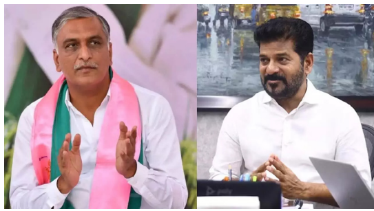
కేసీఆర్ ముందే హెచ్చరించారని గుర్తుచేశారు. అనుకున్నట్లే రేవంట్ రెడ్డి ప్రభుత్వం ఆ దిశగా అడుగులు వేస్తున్నదని చెప్పారు. రైతు భరోసా వస్తదని ఎదురుచూస్తున్న రైతులు, కౌలు రైతులు, ఉపాధి కాలీలు మోసపోయినట్లైనా అని ప్రశ్నించారు. రైతులను విజయవంతంగా మోసం చేసినందుకు రైతు పండుగ నిర్వహిస్తున్నారా రేవంట్ రెడ్డి అని నిలదీశారు. మేనిఫెస్టోలో చెప్పి, రైతులను సమ్మించి అధికారంలోకి వచ్చాకదగా చేసినందుకు విజయవాళి వారా రేవంట్ రెడ్డి అని దుయ్యబట్టారు. రైతుల బతుకులు మార్చేందుకు కేసీఆర్ తీసుకొచ్చిన రైతు బంధు పథకాన్ని నిలిపివేసే కుట్రను బీఆర్ఎస్ పార్టీ తీవ్రంగా ఖండిస్తున్నదని చెప్పారు.

హైదరాబాద్, నవంబర్ 30 (నమస్తే ఉదయం): అనాడు కేసీఆర్ అందించిన సంక్షేమ పథకాలపై బక్కరాజ్య సమితిసాగుకు పెట్టబడి సాయం అందించి రైతులకు భరోసా కల్పించిన రైతుబంధు పథకాన్ని శాశ్వతంగా బండ్ పెట్టే కుట్రకు కాంగ్రెస్ ప్రభుత్వం తెర లేపడం సిగ్గుచేటని సిద్దిపేట ఎమ్మెల్యే హరీశ్ కౌట్యం అందించిన విశ్లేషణ ప్రకారం అని బక్కరాజ్య సమితి సైతం ప్రకటించింది గుర్తుచేశారు. అలాంటి గొప్ప పథకాన్ని ఒక ప్రణాళిక ప్రకారం రూపమాపే ప్రయత్నం చేస్తుండడం దుర్మార్గమని విమర్శించారు. రాష్ట్రంలో 1.53 కోట్ల మెట్రిక్ టన్నుల ధాన్యం దిగుబడి వస్తే 5,19,605 క్వింటాళ్ల సన్న పద్దను క్వింటాలుకు రూ.500 బోనస్ ఇచ్చి కాసుగేలు చేసినట్లు కాంగ్రెస్ ప్రభుత్వం ప్రకటించింది. ఈ లెక్కల రైతులకు దక్కిన బోనస్ సుమారు రూ.26 కోట్లు మాత్రమేనని చెప్పారు. అదే రైతుబంధు కింద ఏడాదికి రూ.7500 కోట్ల రైతుల ఖాతాల్లో జమ చేయాలి ఉంటుందని వెల్లడించారు. కాంగ్రెస్ పార్టీ మ్యానిఫెస్టోలో చెప్పినట్లు ఎక్కడు రూ.15 వేలు చెల్లిస్తే ఇది ఇంకా ఎక్కువ అవుతుందని తెలిపారు. మరీ రైతు బంధు కంటే, బోనస్ అందించడం రైతులకు మేలు ఎట్టవత్తుండో వ్యవసాయ మంత్రి తుమ్మల నాగేశ్వరరావు, రేవంట్ రెడ్డి సమాధానం చెప్పాలని డిమాండ్ చేశారు. అధికారంలోకి రాగానే రుణమాఫీ సగం పందికి చేసి, సగం పందికి మొండి చేయి చూపారని విమర్శించారు. ఆ తర్వాత అన్ని పంటలకు బోనస్ అని, చివరకు సన్నాకం మాత్రమే పరిమితం చేశారని ఆగ్రహం వ్యక్తం చేశారు. ఇప్పుడు రైతుబంధును శాశ్వతంగా రద్దు చేసే ప్రయత్నం మొదలుపెట్టారని మండిపడ్డారు. కాంగ్రెస్ పార్టీ అధికారంలోకి వస్తే రైతుబంధును బంధం చేస్తారని