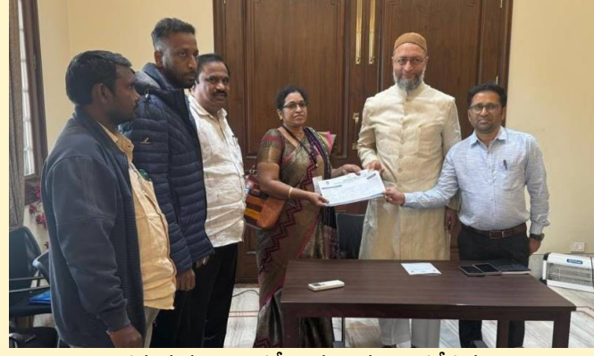
సమగ్ర కుటుంబ సర్వే వివరాలను అందచేస్తున్న హైదరాబాద్ ఎంపీ అసదుద్దీన్ ఓవైసీ