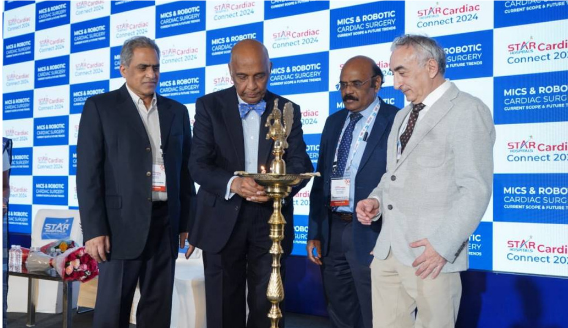
శ్రీశ్రీ ప్రజలను చేసే స్టార్ కార్డియాక్ కనెక్ట్ 2024' ను ప్రారంభిస్తున్న వైద్య నిపుణులు